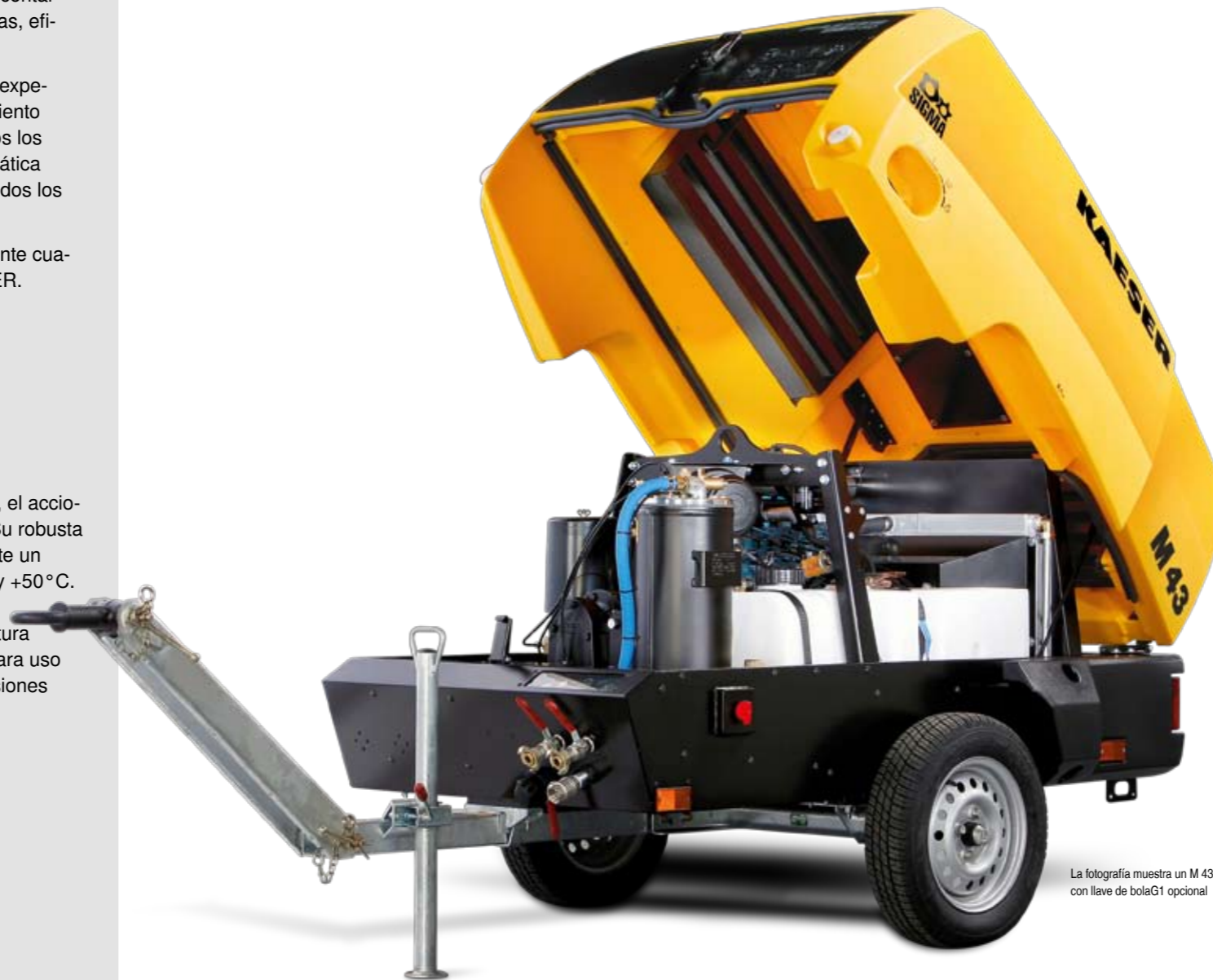
La fotografía muestra un M 43 con llave de bolaG1 opcional